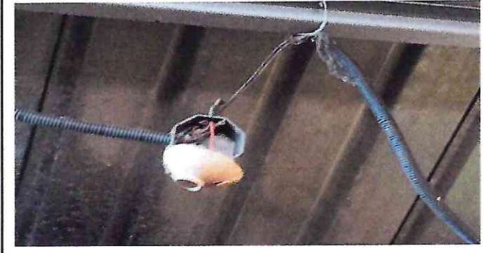
Foto 4: Las conexiones electricas ya no funcionan, lo que ocasiona que la distribución de la corriente electrica no este en todos los salones de la escuela.