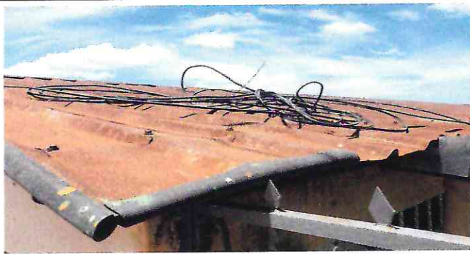
Foto 1: El techo presenta un nivel de corrosión muy alto debido a la exposición al sol y a la lluvia.