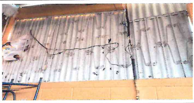
Foto 5: El cableado electrico esta colocado improvisadamente para poder llevar electricidad a algunos salones de la escuela debido a el mal estado de las conexiones electricas.