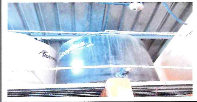
Foto 6: Las sisternas para agua estan deterioradas lo que ocasiona derrame constante de agua evitando que los estudiantes puedan tener agua de manera normal.

Observación: Si es necesario se pueden agregar hojas adicionales y actualizar el número de hojas.