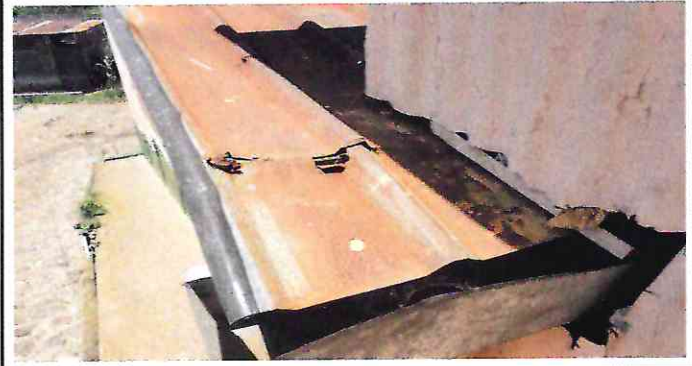
Foto 2: El techo de los módulos presenta muchos agujeros en la superficie lo cual provoca que el agua fluvial se filtre.